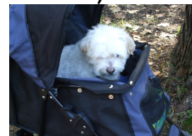
Benny in seinem Hunde Rollator

Lieber kleiner süßer Benny, ich vermisse dich so sehr. Du warst mein ganzes Glück. In meinem Herzen wirst du immer weiter leben.. Danke, dass ich so viele Jahre mit dir verbringen durfte und dass es dich gegeben hat."