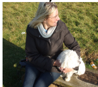
Benny mit Frauchen

„2008 kam Benny mit 7 Jahren zu uns. Es war gegenseitige Liebe auf den ersten Blick und er war vom ersten Tag an unser neues Familienmitglied.