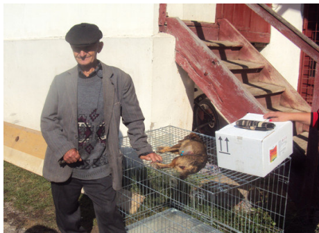
Der alte Herr und sein Hund

Wir konnten bereits im 6. Jahr unsere Kastrationskampagnen in Rumänien mit großem Erfolg durchführen, die unter Federführung von unserem Mitglied und exzellenter Tierschützerin